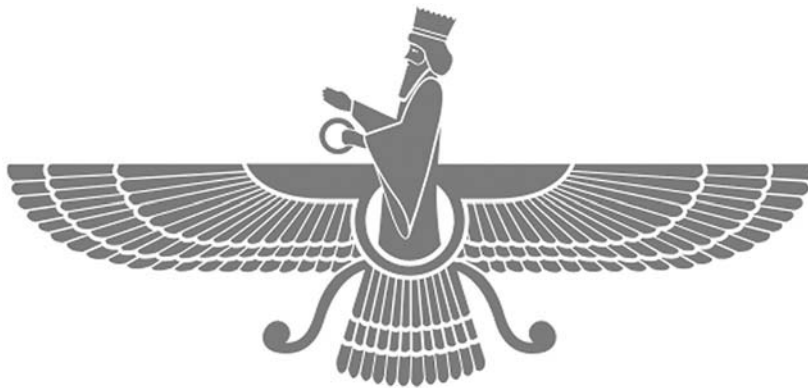
1. kép: Faravahar, a zoroasztrizmus szimbóluma

Jelen dolgozatom célja bemutatni a zoroasztrizmus elképzelését a halálról és a túlvilági életről, illetve felhívni a figyelmet arra, hogy ez az ókori Perzsiában őshonos vallás számos közös vonást hordoz magában a mi zsidó–keresztény kultúránk gondolatvilágával. Szeretném előtérbe hozni azt a hipotézist, miszerint a korabeli zsidóságra gyakorolt zoroasztriánus befolyás segítette elő a mi halál utáni életről való elképzelésünk kikristályosodását. A dolgozatban röviden bemutatom a zoroasztrizmust magát, illetve a halál és a vallások kapcsolatának is szentelek egy bekezdést. Ezután térek rá a zoroasztrizmus túlvilágának ismertetésére, majd egy kapcsolódó szent szöveg segítségével illusztrálok a leírtakat.